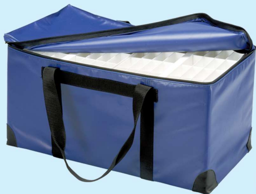
使用例 *ドラッグボックス KH-1048